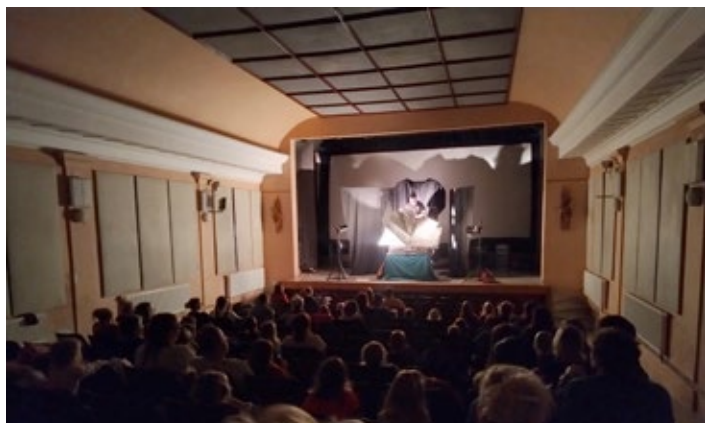
Pohádka Divadla Divoloď