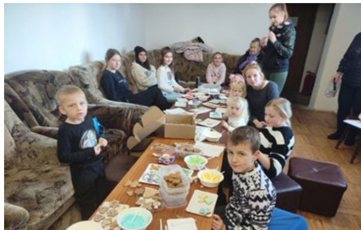
Pečení vánočních perníčků