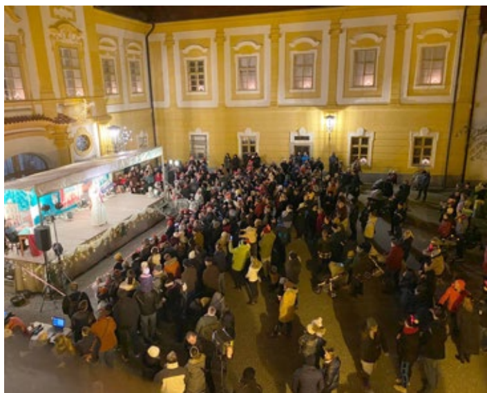
Mikulášské představení divadla ŠOK při ZŠ Borovany