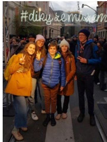
Skauti na Národní třídě v Praze 17. listopadu 2024