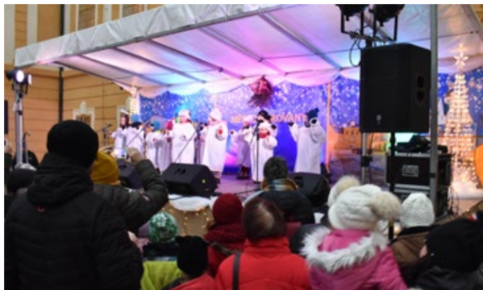
Vystoupení dětí z mateřské školy