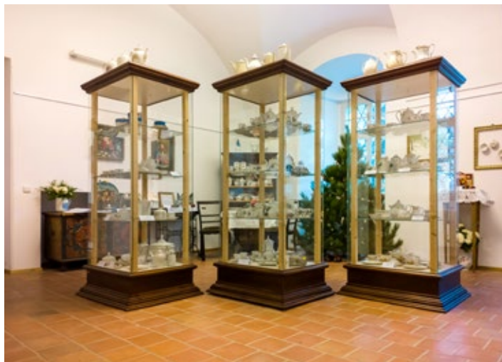
Výstavu Zima v porcelánu navštívte do 14. února