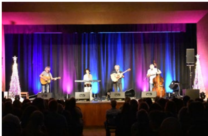
Vánoční koncert kapely Nezmaři