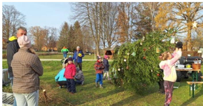
Zdobení vánočního stromečku

Za podporu akcí děkujeme městu Borovany a přejeme všem hodně zdraví a úspěchů v roce 2025.