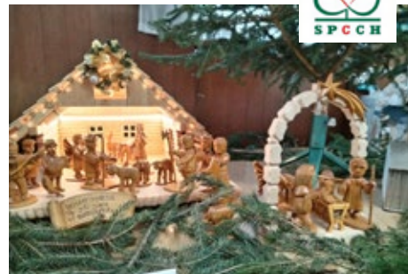
Betlém Jiřího Čunka