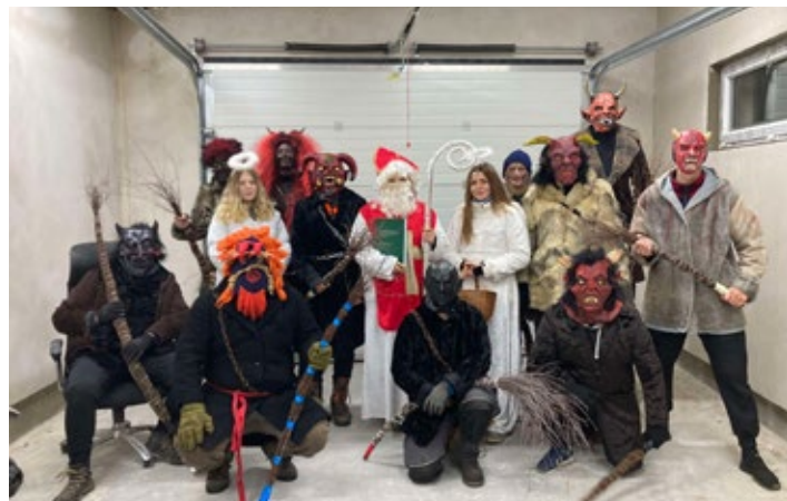
Mikuláš s anděly a čerty