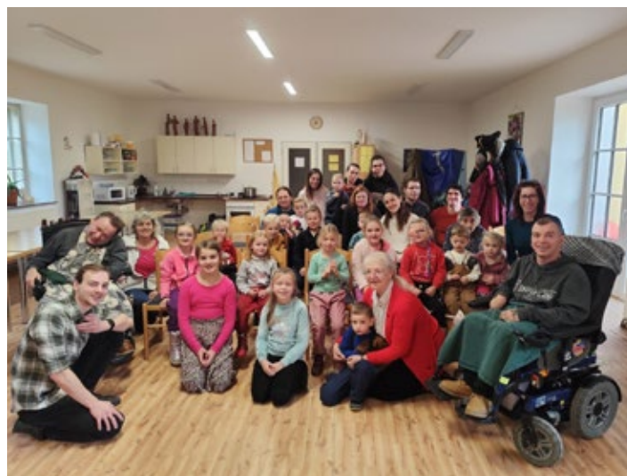
Žáci a učitelé ZUŠ a děti z MŠ v chráněné dílně Nazaret