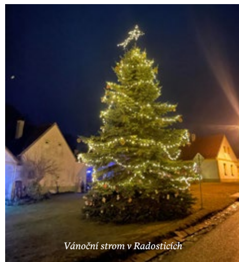
Vánoční strom v Radosticích

V pátek 17. ledna Hasičský bál od 20 h v sále pohostinství Radostice, hraje Obzor V sobotu 1. března Masopust – celodenní průvod po vsi zakončený merendou od 19 h v sále pohostinství Radostice