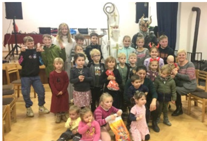
Mikulášská besídka plná tanců a her pro děti