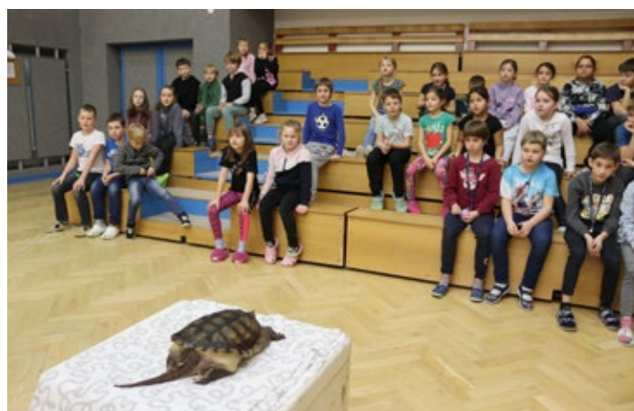
Žáci základní školy se při návštěvě zoo seznámili s méně známými druhy zvířat