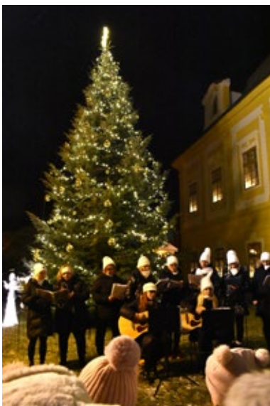
Zpívání u vánočního stromu

Vánoční svátky jsou již za námi a my doufáme, že jste je prožili v klidu a pohodě se svými blízkými. V borovanském klášteře proběhla během prosince řada krásných adventních akcí a my bychom rádi poděkovali všem, kteří se na jejich přípravě a účasti podíleli.